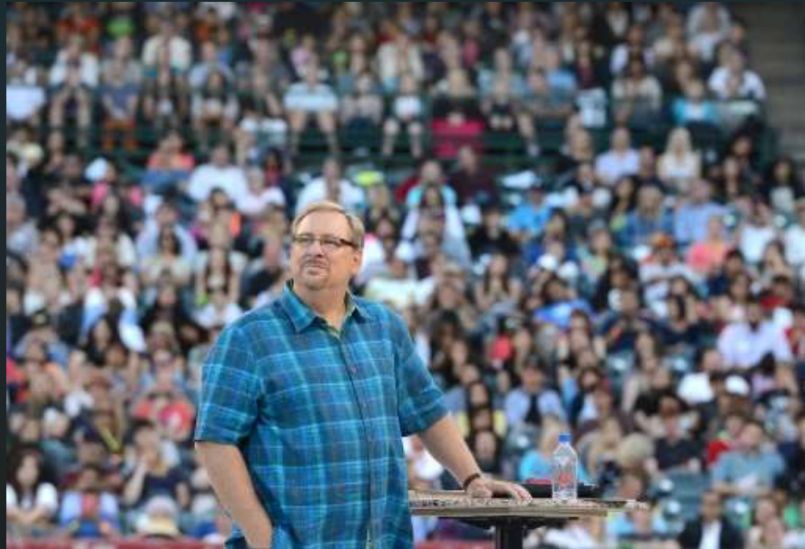
Pastor Rick Warren